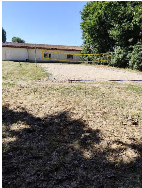
Blick auf angrenzendes Volleyballfeld